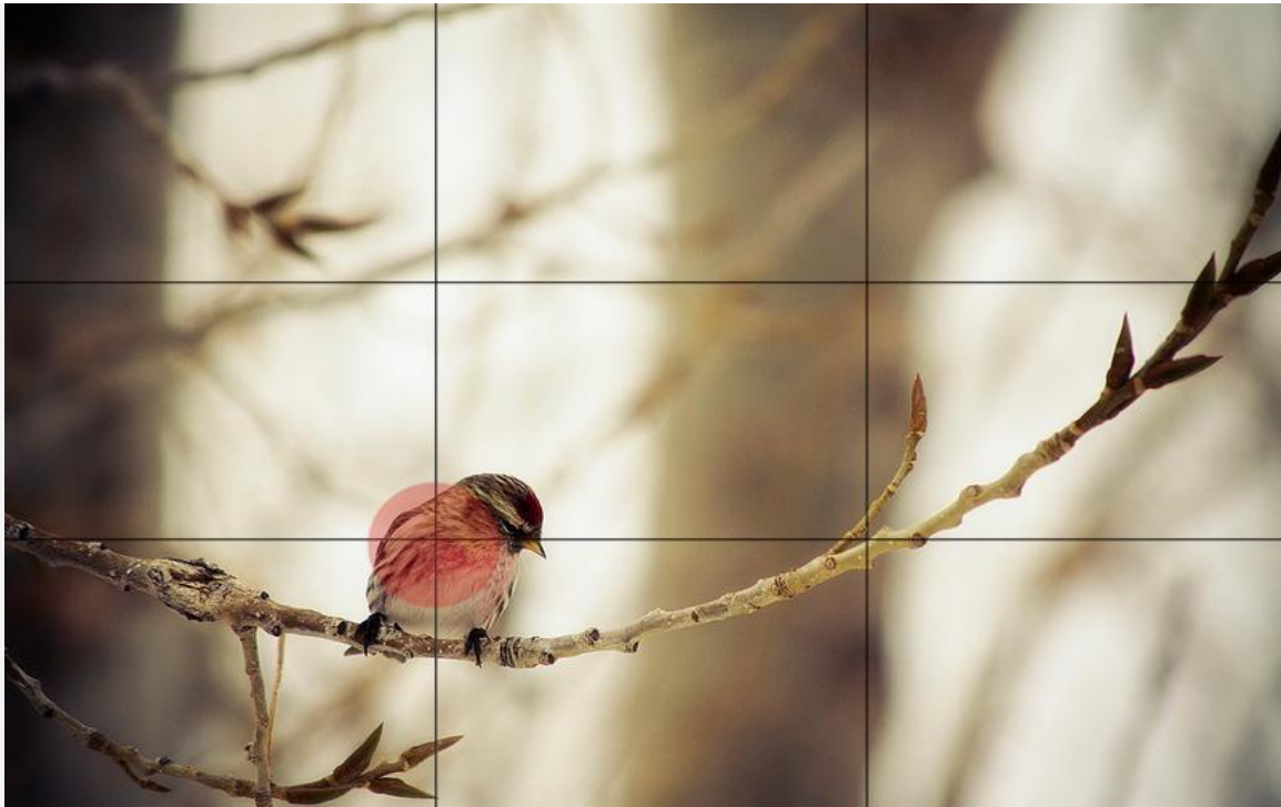
Regla de los Tercios

Esta regla es muy simple pero tiene un tremendo poder en la forma en que visualizamos la foto. Consiste en dividir la imagen, mentalmente, en 9 partes iguales (mediante 2 líneas paralelas horizontales y otras 2 verticales) y a continuación colocar el sujeto en algún punto de intersección de las líneas. Esta foto lo ilustra perfectamente: