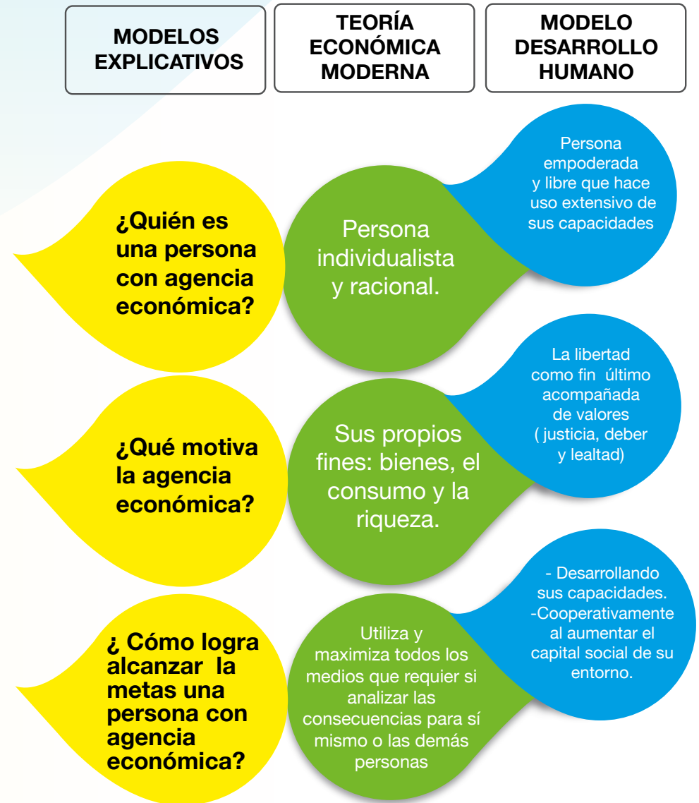
Lámina N° 1. Teoría económica moderna versus Modelo desarrollo humano.

A modo de síntesis, en la siguiente lámina se detallan los principales conceptos que distancian la comprensión de la agencia económica entre la teoría económica moderna y el enfoque de desarrollo humano de Sen.