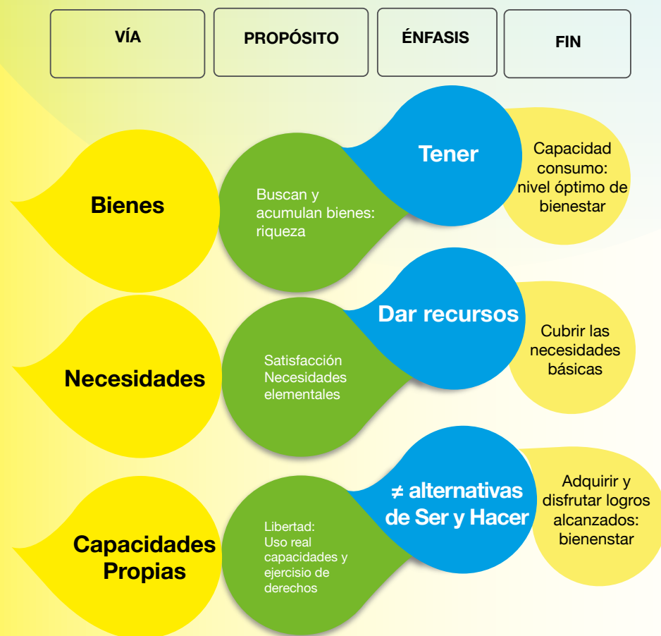
Lámina N° 2. De bienes y necesidades al desarrollo de capacidades propias